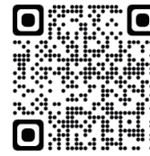
フォトコンテスト 特設サイト