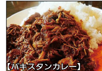
【パキスタンカレー】