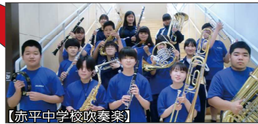
【赤平中学校吹奏楽】