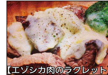
【エゾシカ肉のラクレット】