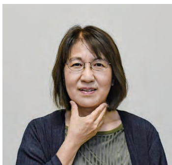
右手親指と ほかの4本の指で

また、借受人の氏名や住所などに変更があったときや貸付財産を市に返還しようとするときはすみやかに届け出をしてください。