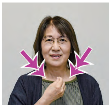
頬をなでるように すべての指を閉じる (2回繰り返す)