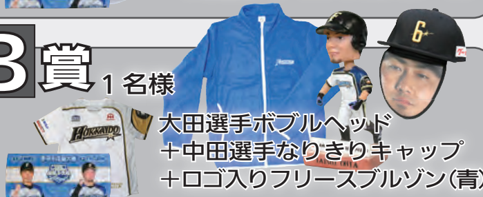
大田選手ボブルヘッド +中田選手なりきりキャップ +ロゴ入りフリースブルゾン(青)