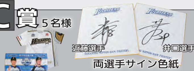
近藤選手 井口選手 両選手サイン色紙