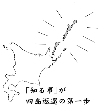
「知る事」が 四島返還の第一歩

北方領土は、私たちの祖先が心血を注いで開拓した日本固有の領土です。北方領土返還実現に向けて、ご協力をお願いします。