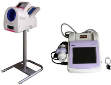
▲自動血圧計 ▲スパイロメーター