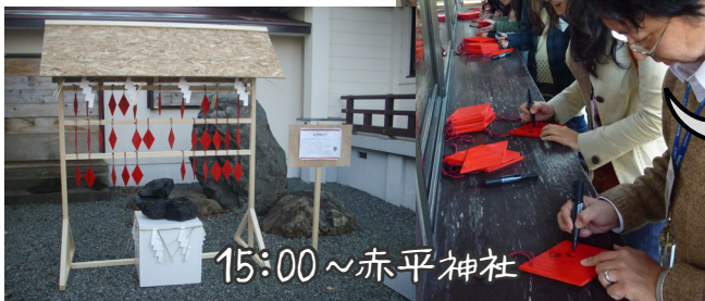
15:00 ~ 赤平神社

情熱の赤い絵馬に願いを込め、赤平神社に奉納し、地中のパワーが宿る石炭のかけらを小瓶にいれ、みんなでお守りをつくりました。