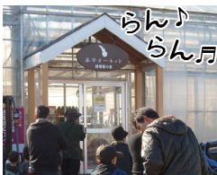
10:15 ~ 赤平オーキッド