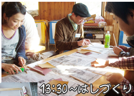
13:30 ~ はしづくり

空知単板工業株から端材をいただき、環境にやさしいマイはしをつくりました。エルム高原のご協力で記念にネームタグもつけました。