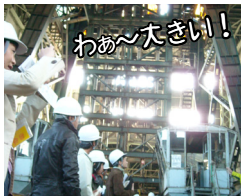
10:40 ~ 住友赤平立坑