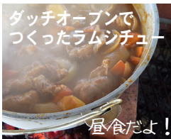
アウトドアクッキング

10月31日、快晴の中、赤平青年会議所が主催する「赤平を100倍楽しむツアー」が開催され、参加者約20名が、一日かけて市内の企業や名所を巡り、新たな発想の体験的ツアーを満喫しました。