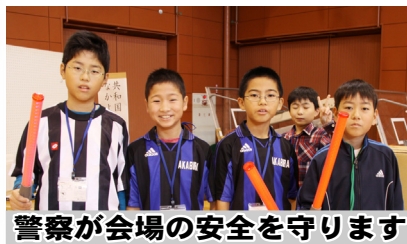
警察が会場の安全を守ります

なかよし共和国は、子ども達が自ら創る国です。入国すると、グリという通貨がもらえ、各村では楽しいくじやゲームなどたくさん遊ぶことができます。子ども達は、様々な社会の役割を学ぶ体験をし、成長します。