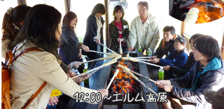
12:00 ~ エルム高原