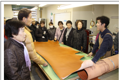
自然度100%の革でつくられる製品の製造工程をご説明いただきました。