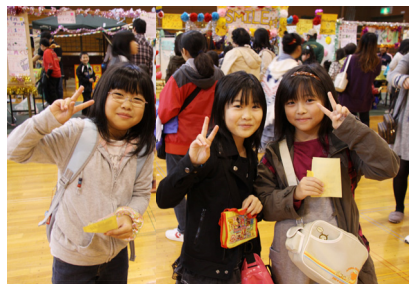
▲会場には笑顔があふれました!