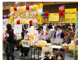
▲楽しいお店がいっぱい!