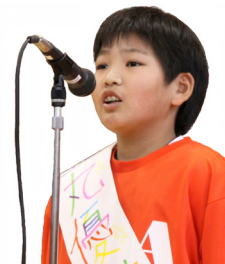
金丸優雅大統領 (野球少年団)