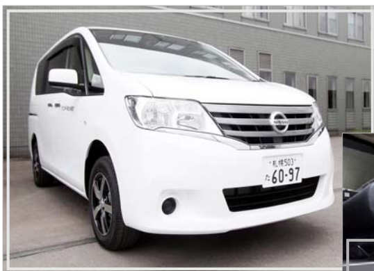
日産セレナ (7人乗り)

ステップが一段出てきて、患者さんの乗り降りの負担を軽減できる仕様となっています。▶