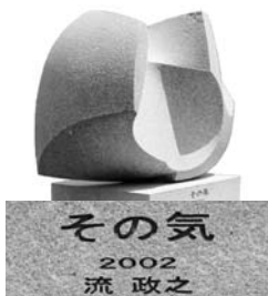
その気 2002 流 政之 高 幅 奥行 91×123×63.3cm