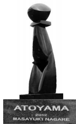
ATOYAMA 2012 MASAYUKI NAGARE 高 幅 奥行 210.6×150×150cm