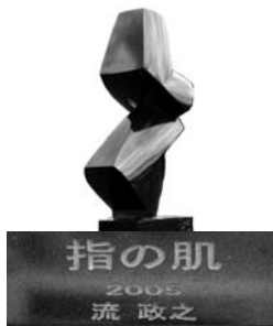
指の肌 2005 流 政之 高 幅 奥行 129.8×43.5×61.3cm