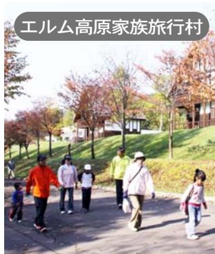
エルム高原家族旅行村

※集合場所のエルム高原家族旅 行村へ直接行かれる方は、第 2駐車場をご利用ください。