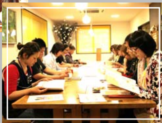
講師がテキストや 絵を使い、認知症に ついてわかりやすく 説明いたします。