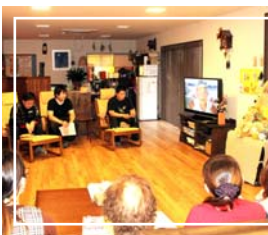
最初にDVDを見て いただいたあと...