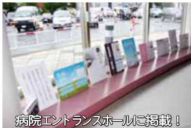
病院エントランスホールに掲載！

発熱があり新型インフルエンザを心配される方につきましては、事前に市立赤平総合病院 ☎ 32 - 3211 までご連絡ください。お電話にて「新型インフルエンザの疑いあり」とお伝えください。