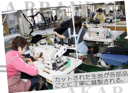
カットされた生地が各部品ごとに丁寧に縫製される。