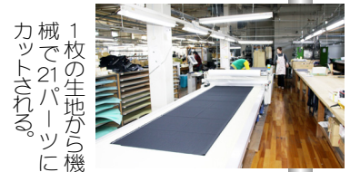
1枚の生地から機械で21パーツにカットされる。