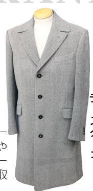
チェスターコート

商品は、メインのスーツのほかジャケットやコート、女性用のスーツやスカートなども取り扱っています。