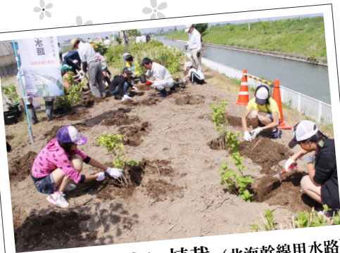
6.12 あじさい植栽 (北海幹線用水路)