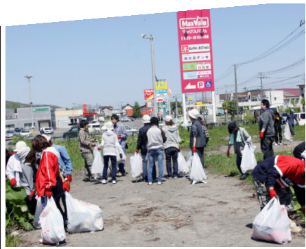
5.30 北海道加ト吉地域清掃