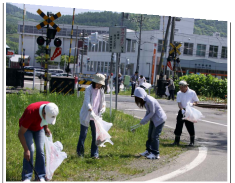
6.12 郵便局等職員地域清掃