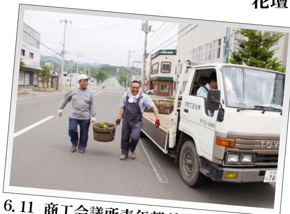
6.11 商工会議所青年部ガーデニング事業