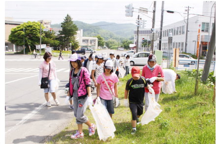
6.19 スポーツ少年団清掃活動