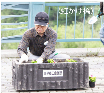
6.3 商工会議所プランター設置