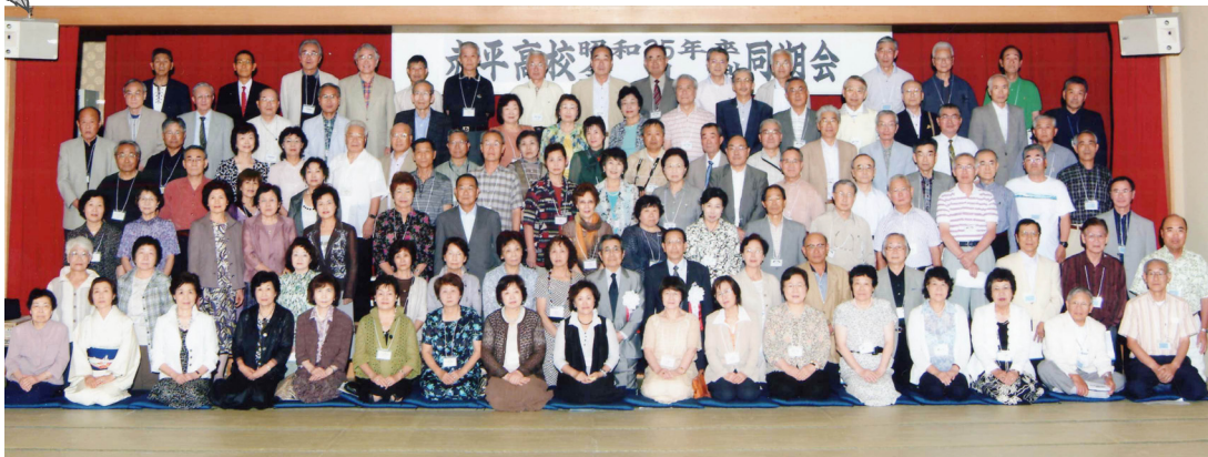
昭和35年卒業 同期会 平成 22 年 7 月 1 日 札幌定山溪章月グランドホテル

存続には赤平高校への志願者の増がもつとも有効な手段です。是非、地元高校への進学者確保に向けて皆さんのご協力をお願いいたします。