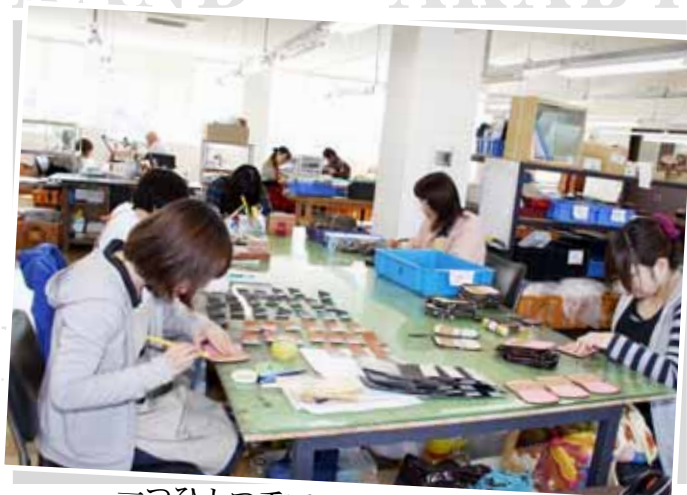
一つひとつ手で作られる革製品

ものづくり産業の振興と地域資源を生かしたたくましい産業の育成に向け、毎月コーナーとして掲載します。掲載をご希望する事業者は、右記までご連絡ください。審査のうえ、掲載決定後に、日程を打合せし、広報広聴係が取材にお伺いします。