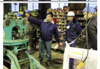
(株) 植 松 電 機

企業見学では、世界に誇るバッテリー式電磁石の開発や製造現場(右)、宇宙開発に関わるロケットの開発、また11月11日に打ち上げられたお菓子の「ポッキー」型ロケット(左)を見学させていただきました。