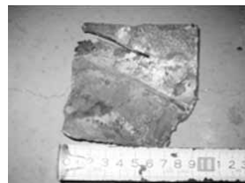
平成26年 10月24日 鉄板 1枚