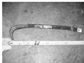
平成26年 5月24日 金属(ボール)