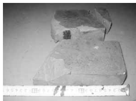
平成23年 8月18日 レンガ 2個

以下の写真は、生ごみを処理する際に混入されており、機械が緊急停止し発見されたものです。