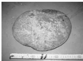
平成24年 11月13日 石 1個