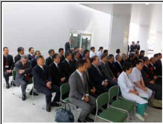
セレモニーには、多くの関係者が参列されました。