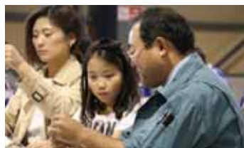
ロケットの体験講座では、年間 1万人以上の子どもが赤平を訪れ、 自分で作ったロケットが空を 飛ぶ姿を笑顔で見上げています。

せん。それはきっと、ものづく りが大好きな気持ちとともに、自 分で考え工夫したことや物事 が良くなつていく過程が嬉しい からだと思います。趣味のエア ピストルの調子が悪かったりし たら、時間も忘れてひとり夢中 になって作業していますよ(笑)。