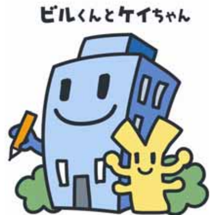
経済センサスキャラクター