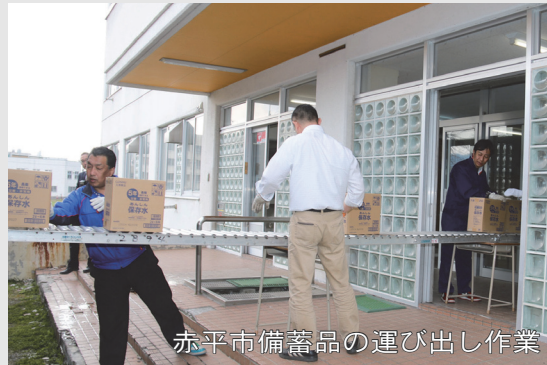
赤平市備蓄品の運び出し作業