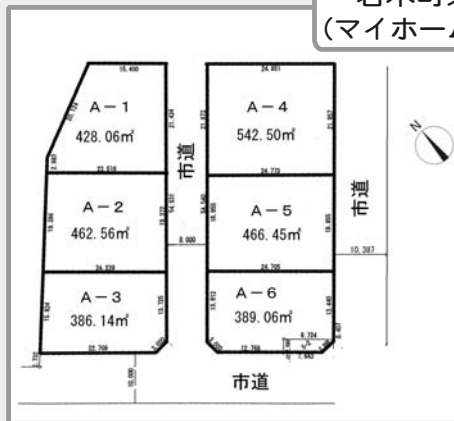
若木町東 (マイホーム用)

所在地 若木町東3丁目2番地 地目 宅地 用途地域 第1種中高層住居専用地域 (建ぺい率60%、容積率200%)