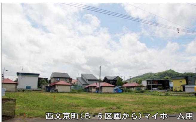
西文京町(B-6区画から)マイホーム用