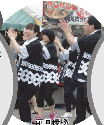
前回優勝 株式会社いたがきチーム