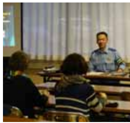
赤歌警察署 生田交通課長が丁寧に解説

6月12日(火)のまちなか公民館講座(NPO法人赤平市市民活動支援センター)で、交通安全教室が行われました。皆さん、自転車の安全な運転を心がけましょう。