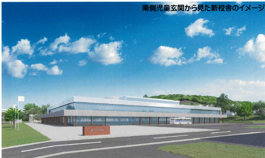
南側児童玄関から見た新校舎のイメージ