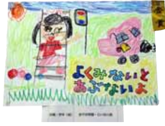
昨年度の保育所・幼稚園の部 金賞作品

表彰式 9月28日(金)16時～ 交流センターみらい4階からいホールで行います。 問合せ 生活環境交通係 ☎32-22215