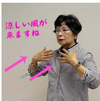
顔に向かってあおぐような動作を2回繰り返す