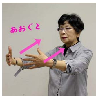
両手の指を広げた状態で...