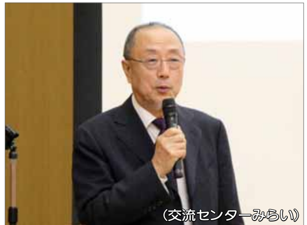
(交流センターみらい)

エリアサポーター養成研修修了者へ修了証とネームプレートが贈られ、新たに23名の心強い仲間が誕生しました。地域の福祉をよろしくお願いします。