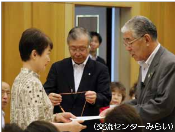
(交流センターみらい)

統合後、新しい校舎で初めての学校祭が行われました。生徒たちの生き生きとした発表は、訪れたたくさんのお客さんを魅了しました。