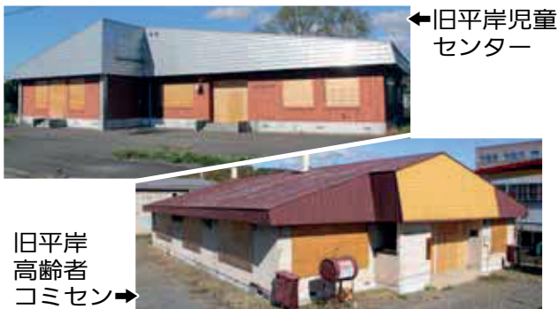
←旧平岸児童センター