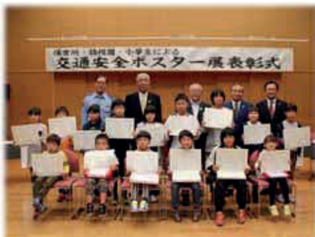
表彰された皆さん