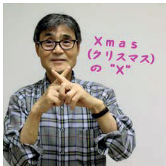
人差指で「X」の印を作った状態で・・・