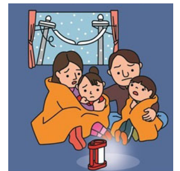
冬の停電

北海道はこれまでも地震により多くの被害が発生していましたが、冬に地震が起きたときは、積雪や寒さなどによって夏よりも被害が大きくなるといわれています。地震はいつ発生するかわかりません。冬の地震災害に対する備えについて紹介します。