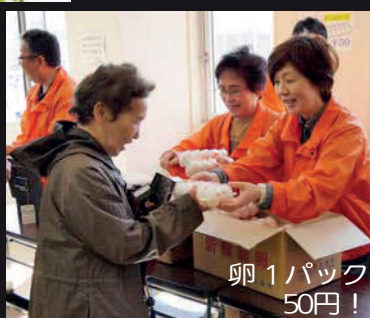
卵 1パック 50円!