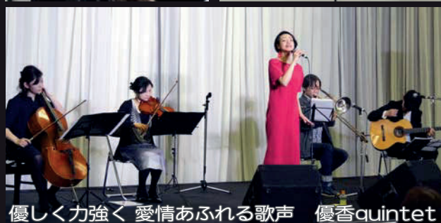
優しく力強く 愛情あふれる歌声 優香quintet