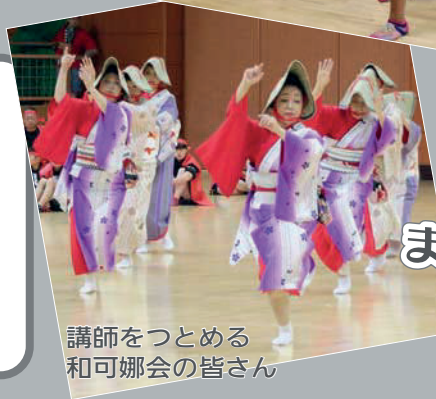
講師をつとめる 和可娜会の皆さん