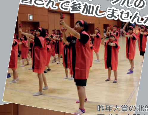
昨年大賞の北部地区 育成会・赤間小学校