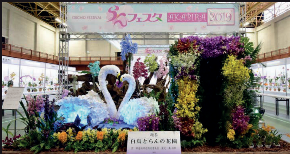
迎え花「白鳥とらんの花園」奥 祥華 作