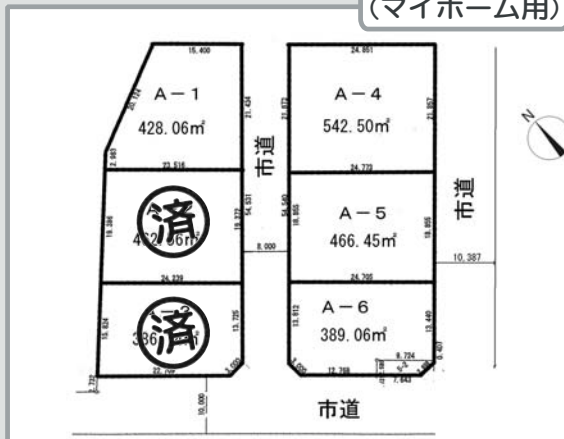
若木町東 (マイホーム用)