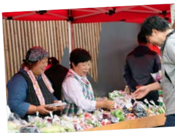
AKABIRAベース とれたて朝市