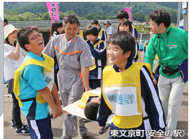
(東文京町 安全の駅)