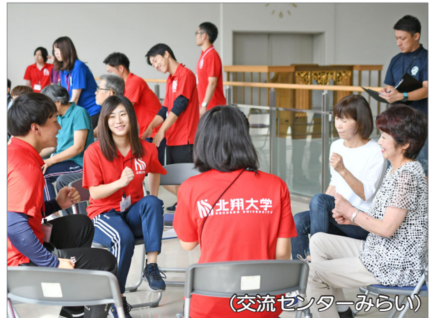
(交流センターみらい)

市の選挙管理委員会から実際に使われている記載台や投票箱を借りて生徒会役員選挙が行われました。「選挙」に触れる貴重な体験ができました。