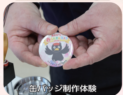
缶バッジ制作体験