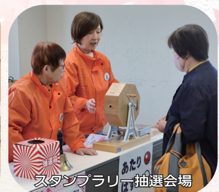
スタンプラリー抽選会場