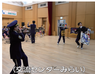
(交流センターみらい)