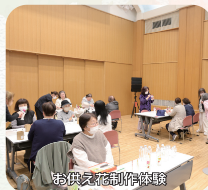
お供え花制作体験