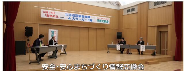
安全・安心まちづくり情報交換会