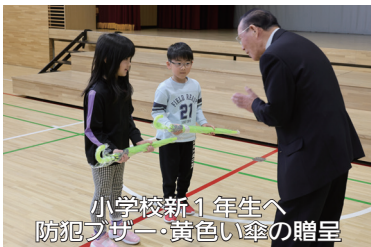
小学校新1年生へ 防犯ブザー・黄色い傘の贈呈