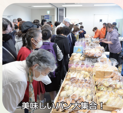
美味しいパン大集合！