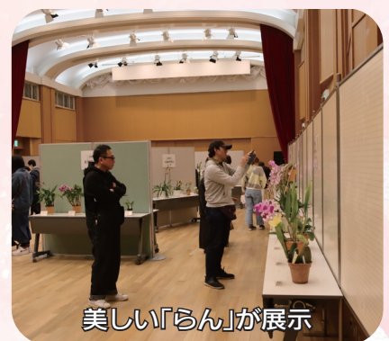
美しい「らん」が展示