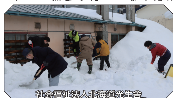
社会福祉法人北海道光生舎