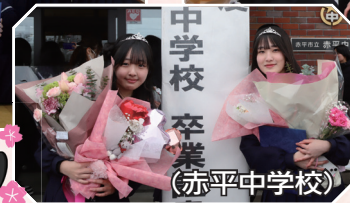
中学校 卒業 (赤平中学校)