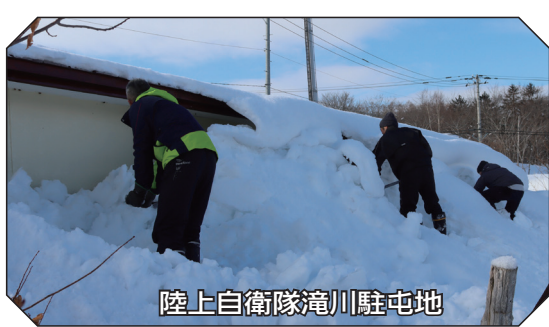
陸上自衛隊滝川駐屯地

2月17日、今年も「植村建設株式会社」「社会福祉法人北海道光生舎」「陸上自衛隊滝川駐屯地」の皆様による、市内の高齢者住宅などを対象とした除雪ボランティアが行なわれました。 軒下をふさぎ、窓を覆っていた重く硬い雪や氷が、手作業で取り除かれました。対象となった高齢者の方からは「雪がきれいになくなって、本当にうれしいです」と感謝の声が寄せられました。除雪ボランティアに参加された皆様ありがとうございました。