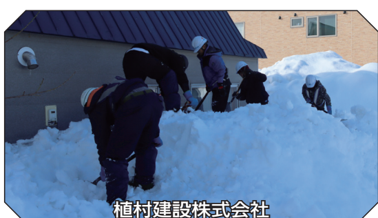
植村建設株式会社

2月17日、今年も「植村建設株式会社」「社会福祉法人北海道光生舎」「陸上自衛隊滝川駐屯地」の皆様による、市内の高齢者住宅などを対象とした除雪ボランティアが行なわれました。 軒下をふさぎ、窓を覆っていた重く硬い雪や氷が、手作業で取り除かれました。対象となった高齢者の方からは「雪がきれいになくなって、本当にうれしいです」と感謝の声が寄せられました。除雪ボランティアに参加された皆様ありがとうございました。