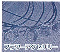
フラワーアクセサリ