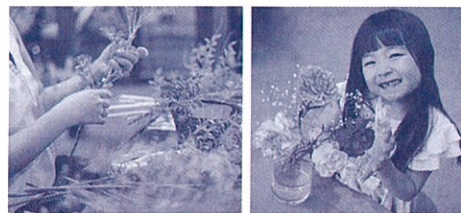
(写真はイメージです)

「ありがとう」の気持ちをこめて、みんなのために 頑張る家族へお花をプレゼントしよう!!