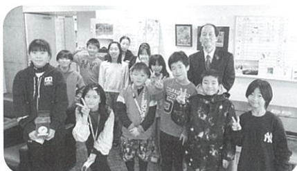
赤平小学校児童会

赤平小学校、赤平中学校さんが募金活動に取り組んでいただきました。 集まった募金はあかびらのまちのために使わせていただきます。ありがとうございました。