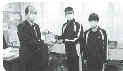
赤平中学校生徒会