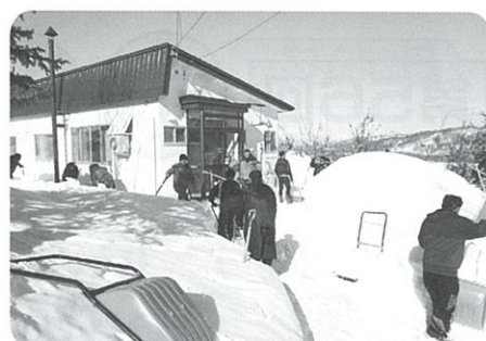
陸上自衛隊滝川駐屯地部隊様