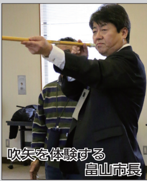
吹矢を体験する 富山市長

赤平支部は、現在11名で活動 しています。吹矢は、小さいお子 さんからお年寄りまで楽しめる 健康的なスポーツです。市長は、 活動内容などを聞いた後、練習の 様子を見学しました。また、実際 に吹矢の体験も行ないました。