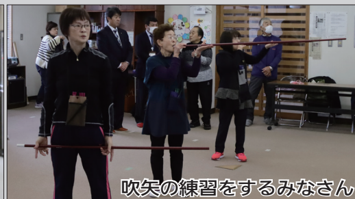
吹矢の練習をするみなさん