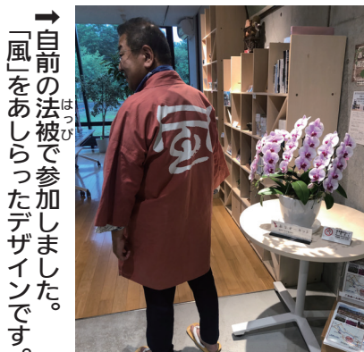
→「風」をあしらったデザインです。自前の法被で参加しました。

第52回あかびら火まつりに参加しました。燃え盛る「火」をテーマにしたこのお祭りは、昭和47年に始まり今年で52回目になりました。4年間待ちに待った関係者は、火のように燃えました。神火を手にした赤フンランナーたちが駆け巡り、赤平のシンボル「777段のズリ山」に火文字が点火されました。フィナーレは夏の夜空を飾る花火大会で祭りは最高潮となりました。