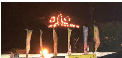
↑雨の中無事に点火した火文字