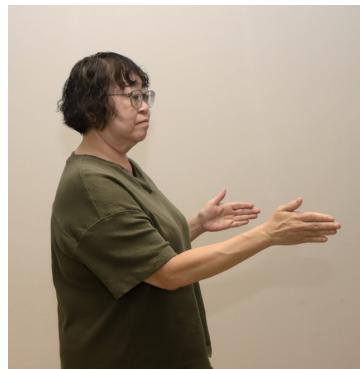
両手の指先を前に向け、 交互に斜め前に出す