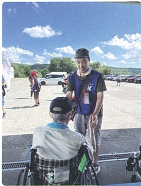
ふれ愛ウォーク ～であい・ふれあい・かたりあい～

市内を3コースに分かれて福祉施設を巡り、ウォーキング。コースには飲食ブースもあり、ゴール後は、キッチンカーでの食事や参加者全員に当たるお楽しみ抽選会、ゲームがあります。