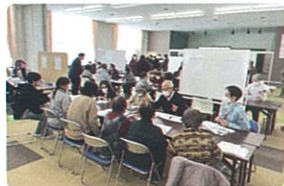
ワークショップ 「地域共生社会ってなんだろう？」

地域共生社会を実現するためには何が必要なのか、赤平市内で具体的に進めるための検討や行政への提言等を行っています。