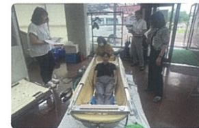
赤平市社会福祉協議会にて、訪問入浴介護事業のサービス説明と訪問入浴車の見学を行いました。

さまざまな相談やニーズに対応するために赤平市及び近郊にある地域資源を把握しています。