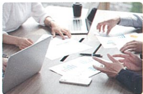
赤平の地域共生社会実現に向けた検討会議の開催