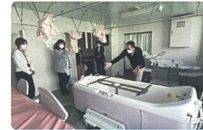
特別養護老人ホームあかびらエルムハイツの施設見学を行いました。