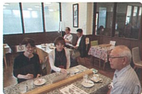
地域共生実現活動 先進地視察

地域共生社会実現に向けた先駆的な活動をされている妹背牛町の取り組みを学びました。