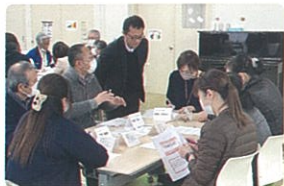
ワークショップ 「ささえ愛♡未来をつくろう！」