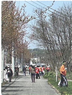
ごみ拾い ～赤平をみんなできれいにしよう～

交流活動部会は、あかびら共生ネットワークの活動だけではなく、市内のイベントにも協力し、地域活動を通じながら共生ネットワークの裾野を広げています。